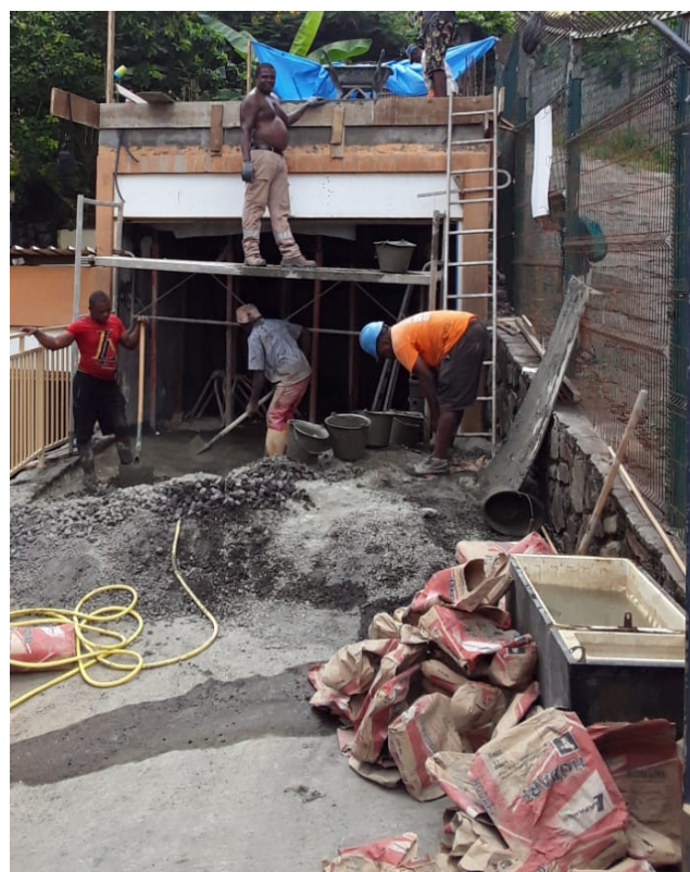
Coulage de la dalle pour soutenir la future citerne