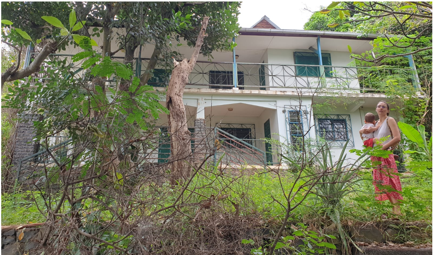
Futur bâtiment espéré pour l'école

Pour nous contacter : grainedemaesha@laposte.net