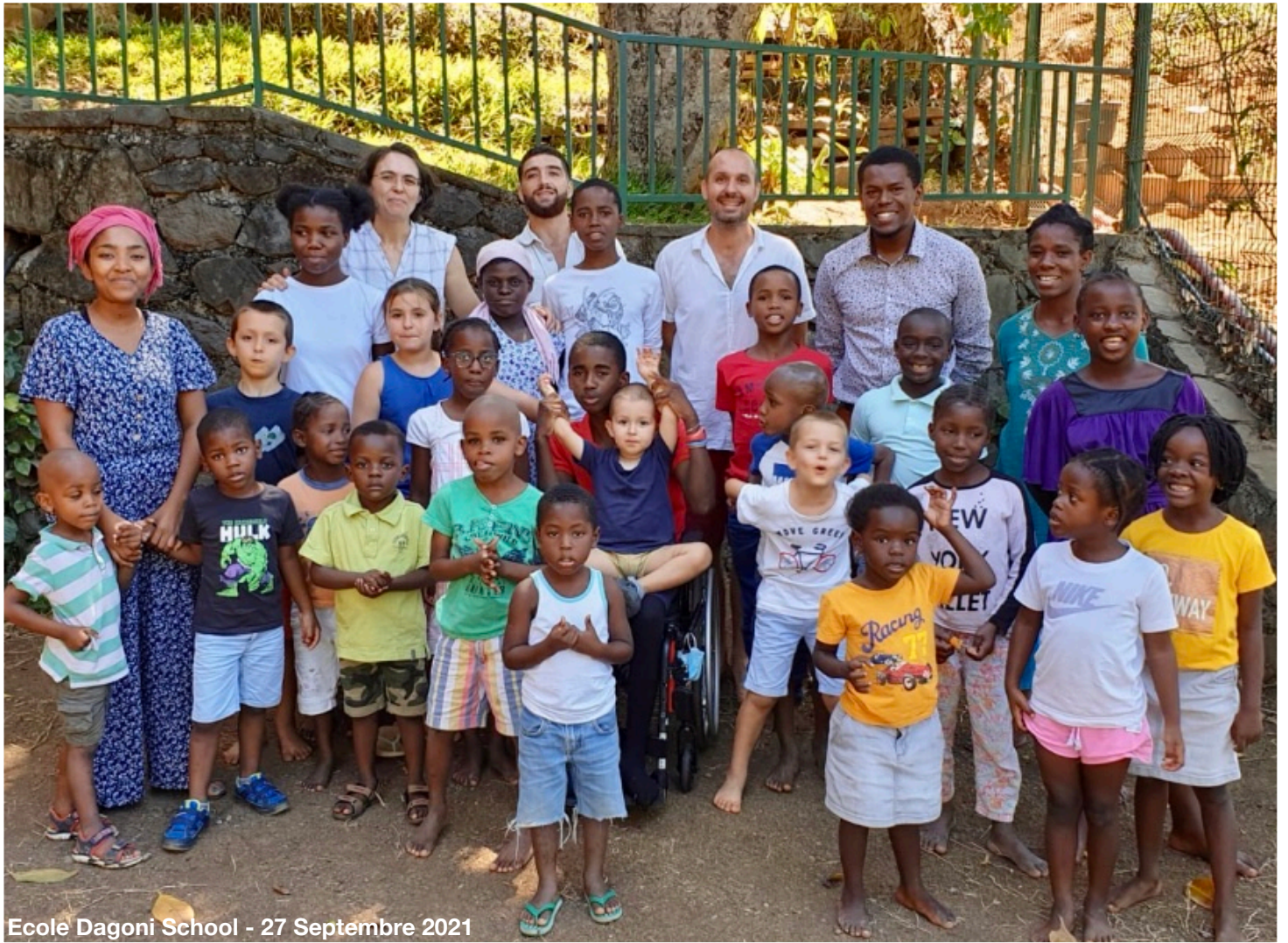
Ecole Dagoni School - 27 Septembre 2021